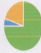
удовлетворенность качеством питания

■ удовлетворен ■ не удовлетворен ■ удовлетворен частично