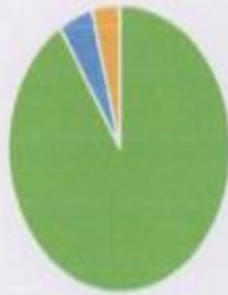
создание условий для обучения

■ созданы ■ не созданы ■ частично созданы