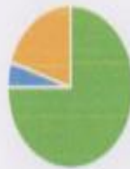
удовлетворенность качеством питания

■ удовлетворен ■ не удовлетворен ■ удовлетворен частично