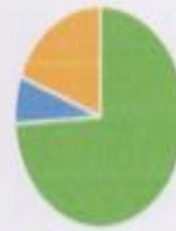
удовлетворенность санитарно-гигиеническим состоянием групп

■ удовлетворен ■ не удовлетворен ■ удовлетворен частично ■